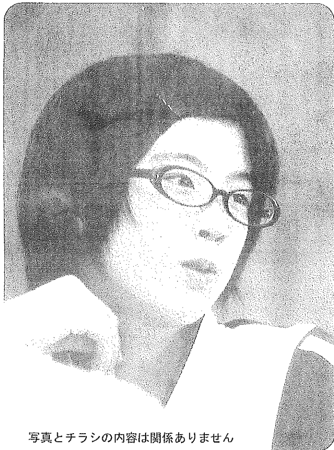
写真とチラシの内容は関係ありません