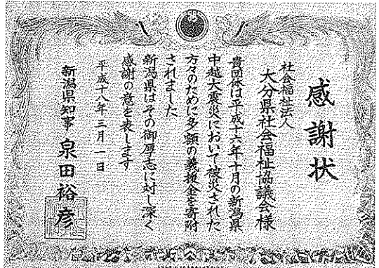
<新潟県知事より贈られた感謝状>

のではありませんが、間接的に被災者を支えます。▼新潟県中越地震災害が起こつた後、スマトラ沖地震など世界各地でも大災害が起こり、新潟が報道される機会が減つたためみなさんの記憶から薄れてきているのでしようが、新潟では二年連続の豪雪のため被災地の復興ができず農業従事者や養鯉業者等の生活再建が完全ではありません。そして今も新潟県内には、現地に移り住み被災者に寄り添つた活動を続けているボランティア団体があります。問題はまだまだ山積みです。支える人たちの継続的な支援はこれからも必要でしょう。▼今回は被災地を支援する役割分担の一部をご紹介します。なかつたものが戻つてくるわけはありませんが、たくさんの方々の温かい支えによって新潟はゆつくり復興に向かっています。(文責/村野)