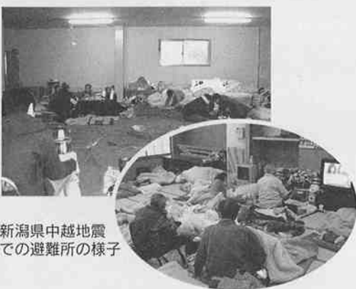
新潟県中越地震での避難所の様子

の上を直撃しました。なんとか腕の力でタンスをどけて出ることができたが、足が動きません。骨折しているようです。強靱な若者で普段は地域で頼りにされている男性でも、このような状態になりますと彼も「災害時要援護者」になり、誰かのサポートがなければ、避難する事も出来ないのです。「災害時要援護者」は誰もがなりうることであり、災害が起こる前から準備しておくことや、それにむけたさまざまな行動が必要なのです。▼第二の理由としては、日頃からサポートが必要な方は、やはりなんらかのサポートが必要になるということ。ただ、通常サポートしている方が携われるかという、必ずしもそうではありません。むしろ不可能だといつていいでしょう。そうなると必要になってくるのは、生活を行っている地域でのサポートです。日頃は近所に住んでいるというだけで、接点がないかもしれせんし、お住まいになつていないことさえ知らなかったというような被災地からの報告もあります。ここでみなさんに一緒に考えていただきたいのは、支える仕組みを地域でどのように作つてお