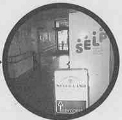
自販機とレストラン